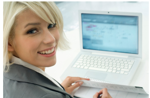
Slimme software voor leren & talentontwikkeling

Op basis van ons Leerhuismodel vertalen we eerst uw doelen naar de benodigde kennis en vaardigheden. Daarbij maken we graag gebruik van uw functiebeschrijvingen en competentieprofielen. We stellen de leerbehoefte vast en helpen u bij het vinden en ontwikkelen van een passend opleidingsaanbod. Ook het inkopen van klassikale opleidingen of het ontwikkelen van e-learning programma's horen daarbij. Als u intern opleidingsaanbod heeft passen we dit in.